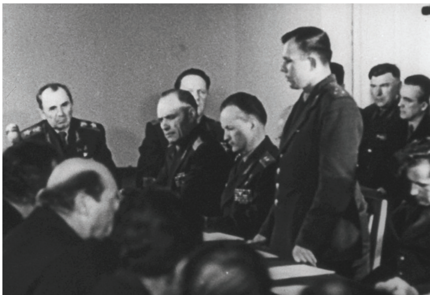
Рис. 5. Государственная комиссия утверждает Ю.А. Гагарина первым пилотом-космонавтом космического корабля «Восток», 10 апреля 1961 года

После космического полета Юрий Гагарин участвовал в подготовке космонавтов, а затем в 1966–67 годах сам готовился к полету на многоместных кораблях «7К-ОК» в качестве командира дублирующего экипажа. Структура системы подготовки за несколько лет значительно изменилась.