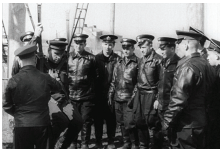
Парашютная подготовка 1-го набора в отряд космонавтов, г. Энгельс, Саратовской обл., 1960 г.