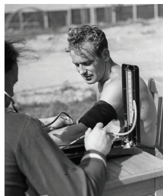
Г.С. Титов на медицинском обследовании, 1960 г.