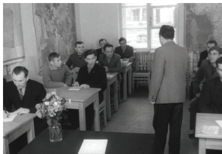
Первый отряд космонавтов на теоретической подготовке, 1961 г.