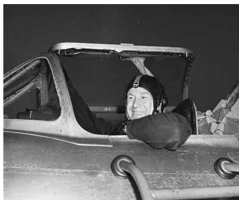
А.А. Леонов на летной подготовке, п. Чкаловский, 1961 г.