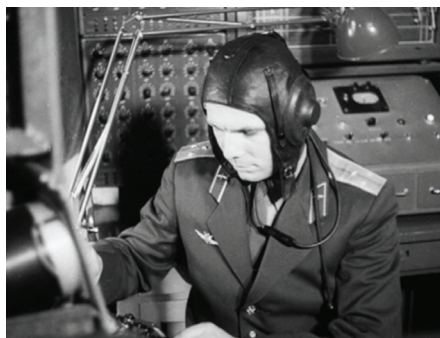
Ю.А. Гагарин во время тренировки на тренажере космического корабля «Восток» в Летно-исследовательском институте, 1961 г.