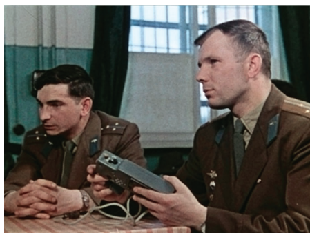
В.Ф. Быковский (слева) и Ю.А. Гагарин на занятиях, 1960 г.