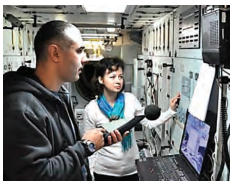
Рис. 3. Практическое занятие по выполнению научно-прикладных исследований и экспериментов

На диаграмме (рис. 5) показано количество тренировок (не считая практические занятия), проведенных на ТК в период с 1999 года по 2018 год включительно.