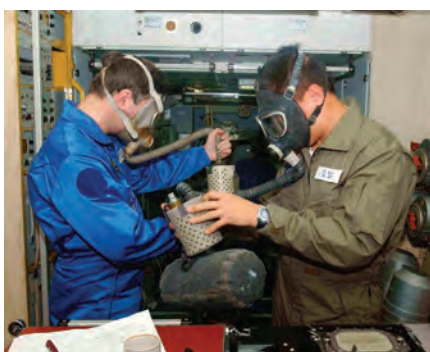
Рис. 4. Тренировка по отработке действий экипажа в нештатной ситуации