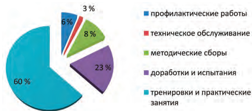
Рис. 2. Соотношение основных видов работ на тренажерном комплексе РС МКС

Практические занятия по конструкции и компоновке модулей, а также по работе с научной аппаратурой, по подготовке и выполнению космических экспериментов проводятся под руководством специалистов по подготовке космонавтов, которые во время занятия находятся рядом с обучаемыми в РМО (рис. 3).