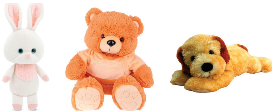
Рис. 3. Наиболее распространенные образцы игрушек-индикаторов

Игрушки. На втором месте (13,4 %) находится категория «Малоформатные игрушки». Это совершенно новая категория предметов, появившаяся только в 2010 г. Космонавт в стартующем корабле прочно пристегнут к ложементу и для визуального определения наступления момента невесомости служит свободно свисающая с приборной панели мягкая детская игрушка – индикатор невесомости. Первые игрушки-индикаторы невесомости документировались 14 сентября 2009 г. для МКС-21/22 («Львенок») и в марте 2010 г. для МКС-23/24 («Утенок» и «Бурундук»). Потом были «Гном», «Зайчик», «Медвежонок», «Щенок» и многие другие, общим числом 67 (рис. 3). Изначально это были просто домашние игрушки детей или внуков космонавтов (как правило, командиров экипажей ТПК). Однако игрушки должны были быть новыми или прошедшими специальную тщательную обработку, небольшими по размеру и легкими, атравматическими и соответствовать требованиям медицинской безопасности. В последнее время в личные вещи отбирались игрушки, сделанные детьми космонавтов.