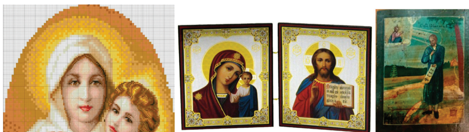
Рис. 6. Наиболее типичные предметы религиозного содержания

Новые категории вещей. Совершенно новая категория в составе личных вещей космонавтов – предметы религиозного содержания. Представить такое в эпоху атеистического СССР просто невозможно. Со снятием ограничений принятая формулировка категории позволяет члену экипажа включать в состав своих личных вещей любой предмет религиозной направленности, соответствующий требованиям инструкции, безопасности и здравого смысла космонавта и специалистов по отбору и укладке личных вещей (рис. 6). В настоящее время доля предметов данной категории в общем количестве рассмотренных личных вещей составляет 9,2 %. Среди отобранных предметов преобладают иконки-аппликации на бумаге, малоформатные деревянные иконы, иконки-складни. Также отмечены нательные крестики, образки, священные книги (малоформатный вариант), иконы-вышивки, четки. Икона «Георгий Победоносец» побывала в космосе четыре раза. Из 65 членов экипажей не включали в состав личных вещей никаких предметов религиозного содержания 19 человек (30 %).