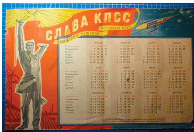
Рис. 1. Календарь на материю

С 2005 г. в число разрешенных личных вещей были включены шесть новых категорий, что в целом оправданно и своевременно, а по некоторым позициям даже сделано с опозданием. Так и во времена СССР космонавты часто брали с собой в полет небольшой крестик, свой крестильный или из рук матери как благословение. Делали это неофициально, и статистика по этому вопросу отсутствовала. Длительно существовал запрет на обручальные кольца – даже при кратковременном ношении в космосе возникала большая проблема из-за отеков пальцев. Техникой безопасности объяснялся и запрет на личные очки, которые по тем временам были исключительно со стеклянными линзами. А стекло на борту ТПК и станции всегда было, есть и будет одним из самых табуированных материалов. Практически вечно сохраняющиеся осколки могут не только нанести открытую рану, но и в условиях невесомости попасть с воздухом в дыхательные пути, что при неизбежном обильном кровотечении приведет к неблагоприятному исходу. Отсюда и медицинские ограничения по зрению для кандидатов в космонавты. Вопрос решился только с появлением травмобезопасных оптических пластмасс, не уступающих по качеству стеклу, и неломоющихся титановых дужек. Первые очки включены в состав личных вещей членов экипажа МКС-23/24 в октябре 2011 г.