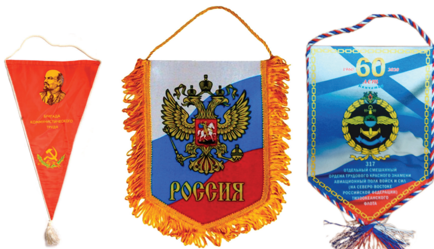
Рис. 2. Вымпелы

Вымпелы. Первое рейтинговое место по популярности для отбора в состав личных вещей (15 %) принадлежит категории «Вымпелы». Вымпел – это универсальный, достаточно долговременный носитель любой необходимой информации, который может применяться как в личном, так и в публичном пространстве. В качестве личных вещей чаще используются вымпелы с символикой страны, города, ведомства, организации, учебного заведения или приуроченные к каким-либо памятным датам. Как правило, информативно вымпелы связаны с личной жизнью или биографией космонавта. Исторически – это одна из самых «старых» категорий личных вещей. Если вначале это был однослойный матерчатый (из натуральных тканей) треугольный вымпел с простым односторонним рисунком или надписью, то со временем он превратился в шедевр сувенирной продукции – двусторонний, из прочной и красивой искусственной ткани с многоцветным ротапринтным рисунком и богатой отделкой витой цветной нитью по краям (рис. 2).