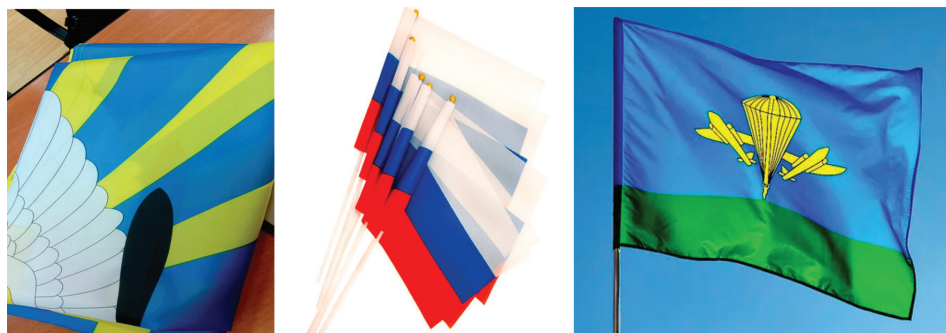
Рис. 4. Часто встречаемые в личных вещах образцы флажков и флагов

включить в состав своих личных вещей как можно больше таких предметов, благо весят они немного (10 шт. – 15 г) и мало занимают места (стандарт 110 x 220 мм). С появлением современных материалов и множества пошивочных мастерских флажки перестали быть дефицитным изделием, получаемым по разнарядке, как 20–30 лет назад.