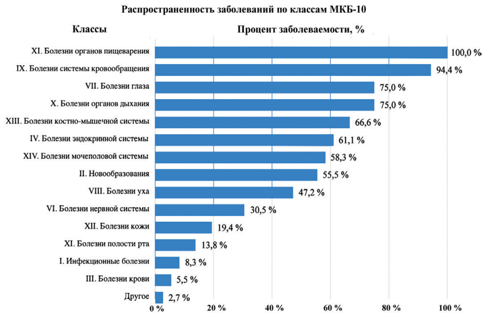
Рис. 3. Диаграмма распределения частоты встречаемости заболеваний по МКБ среди обследованных космонавтов:

другое – симптомы, признаки и отклонения от нормы, выявленные при клинических и лабораторных исследованиях, не классифицированные в других рубриках; классы – заболевания по МКБ-10 сокращены для наглядности